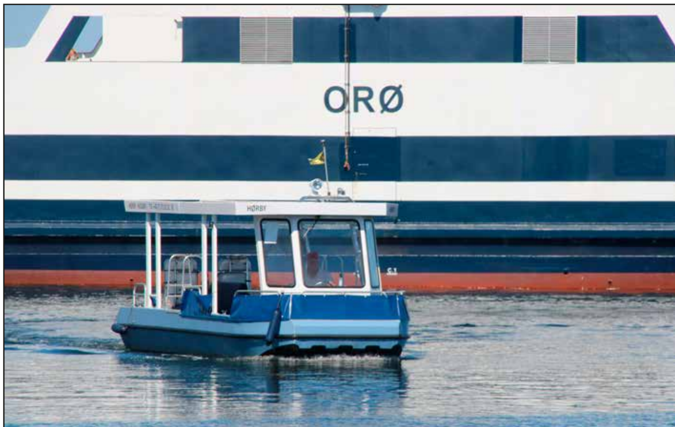
"Hørby" på vej ind til Holbæk med færgen til Orø i baggrunden. Foto: Erik Wilhelmsen den 9. juli 2023.

Men Finn Fogtmann syntes ikke, at man kunne kalde det en færgekro uden en færge, og derfor købte han