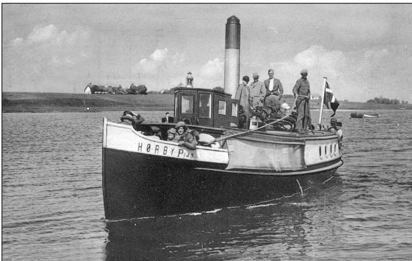
Den første "Hørby" på Holbæk Fjord.

Det var ikke det eneste problem. Der skulle også findes en velegnet færge, som var en vigtig brik i plottet i filmen. Filmfolkene var i april ude at kigge